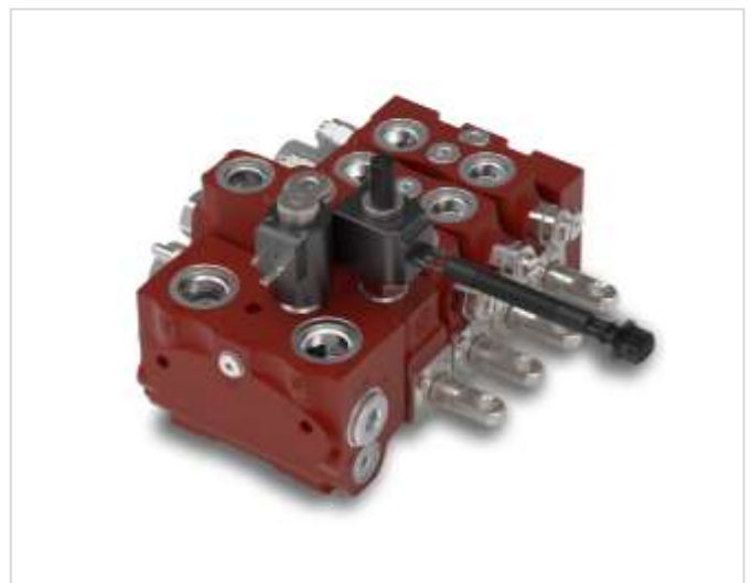
SD8 – distributore componibile per centro aperto