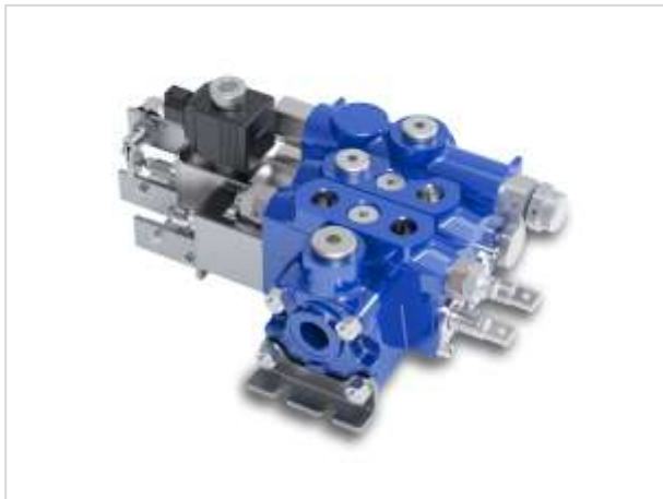
DVS10 – distributore componibile per centro aperto

Nuovi distributori monoblocco e componibili specifici per i mercati asiatico e americano sono stati recentemente lanciati, evidenziando la capacità di Walvoil di bilanciare sempre al meglio il rapporto tecnologia/costo, grazie all'ampia gamma di prodotti.