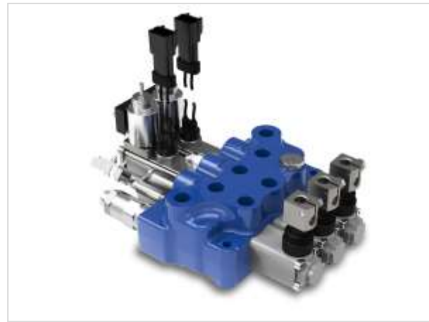
FL50 – distributore monoblocco per centro aperto

Completano l'offerta Walvoil una serie di prodotti elettronici fondamentali per i carrelli quali: